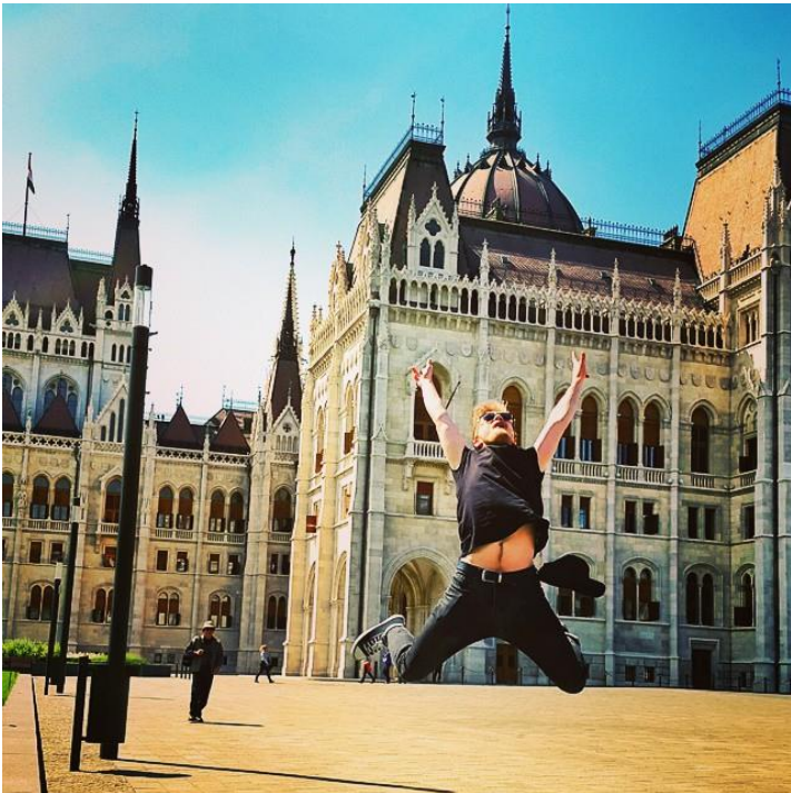
Budynek parlamentu w Budapeszcie

Chyba każdy z nas zna powiedzenie "Polak, Węgier, dwa bratanki, i do szabli, i do szklanki". Jest tak również w przypadku Węgrów. Jesteśmy podobnymi narodami, darzymy się wzajemną sympatią, zatem proces adaptacji w nowej kulturze nie był w żadnym wypadku trudny, a wręcz przyjemny i stosunkowo szybki. Z perspektywy czasu, oceniam mój wybór za idealny i gdybym miał wybierać jeszcze raz miejsce mojego pobytu, bez zastanowienia wybrałbym Budapeszt jeszcze raz!