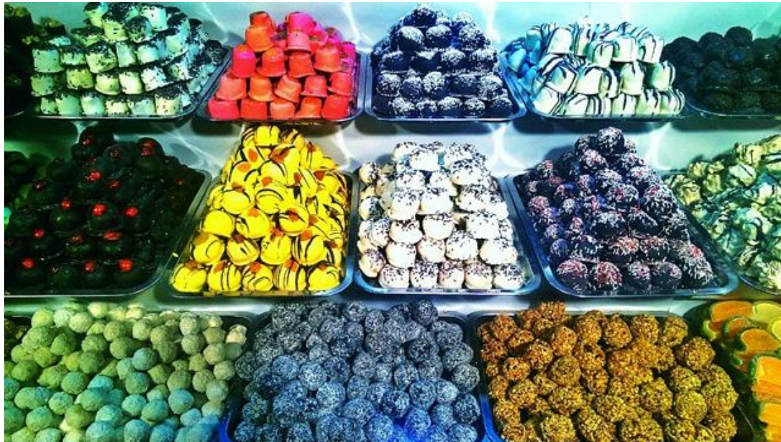
Hungarian Gastro Festival