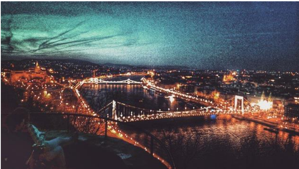
Widok na Budapeszt z Góry Gellerta

Budapeszt, perła Dunaju, to prawie dwumilionowe miasto. Jest to tętniąca życiem metropolia, która nigdy nie zasypia, uważana za jedną z najpiękniej usytuowanych stolic na świecie. W trakcie tygodnia odbywa się tutaj kilka (o ile nie kilkanaście) imprez dla studentów z zagranicy. Wielkim plusem jest również duża ilość organizowanych festiwali, podczas których możemy obcować z lokalną kulturą. Samo miasto jest przepiękne oraz różnorodne- możemy zobaczyć starożytne ruiny, tureckie łaźnie, barokowe kościoły, jak i wzorowane na paryskich, bulwary i aleje. Ponadto, Budapeszt łączy elementy typowej metropolii z cechami letniego kurortu. Są miejsca, niekoniecznie bardzo oddalone od centrum, w których można zapomnieć o cały zgiełku wielkiego miasta.