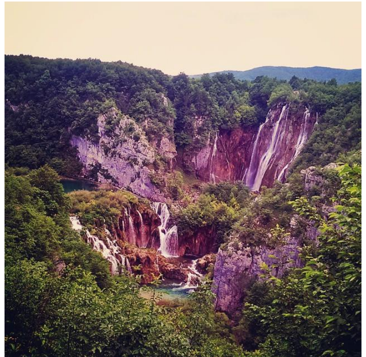
Jeziora Plitwickie, Chorwacja